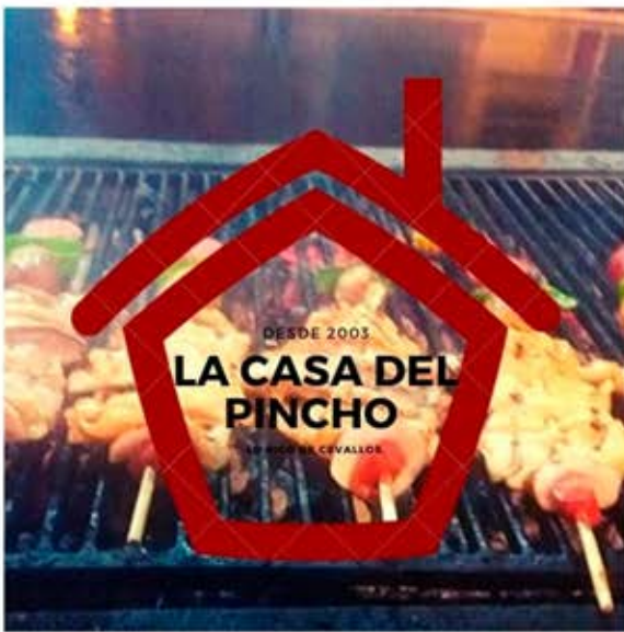
LA CASA DEL PINCHO Juan Naranjo y familia Lo más rico de Cevallos desde 2003